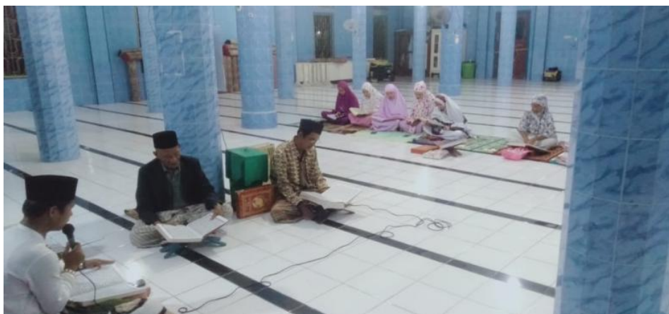
Gambar 1. Majelis Taklim dalam kegiatan pengajian di Masjid Jami At-Taqwa