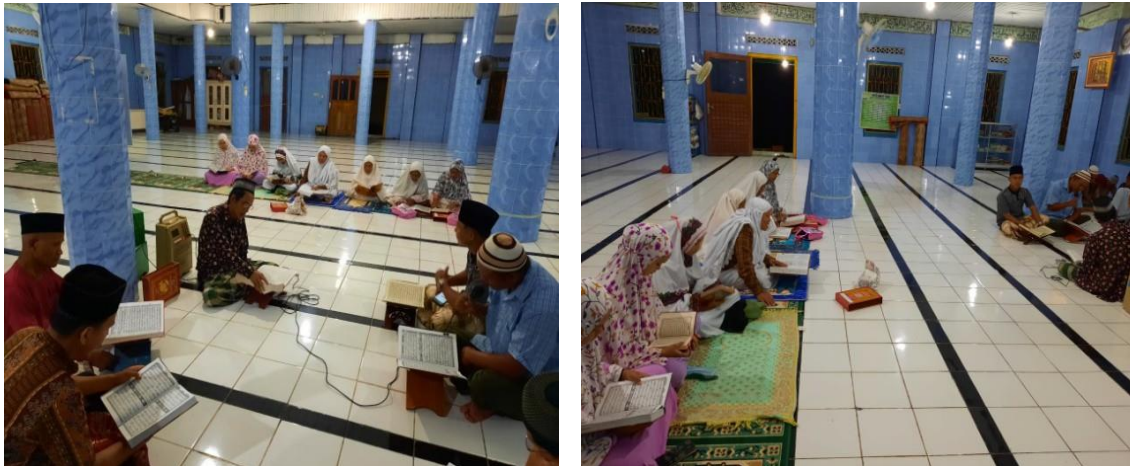
Gambar 2. Implementasi Majelis Taklim dalam kegiatan pengajian sebelum shalat isya' berjamaah di Masjid Jami At-Taqwa